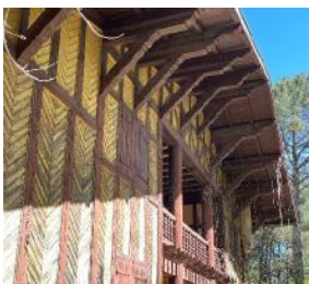
Détail façade et avant-toit