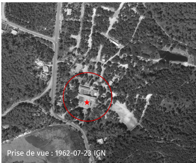
Prise de vue : 1962-07-23