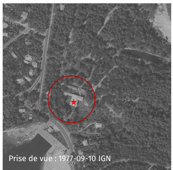
Prise de vue : 1977-09-10