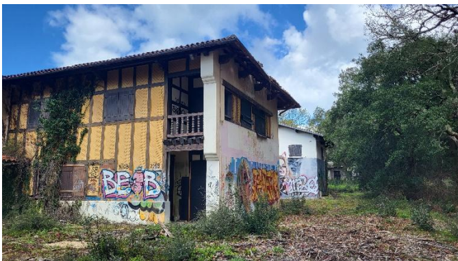
Aile en retour