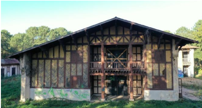
Façade sud bâtiment principal