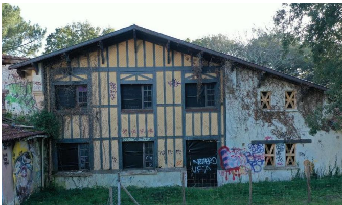
Façade nord bâtiment principal